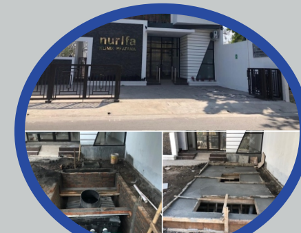
Klinik Pratama Nurifa, Kab. Sukoharjo