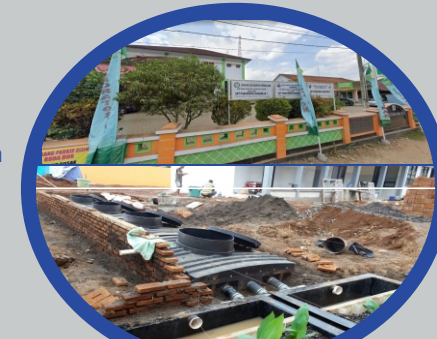
Puskesmas Wanareja 1, Kab. Cilacap